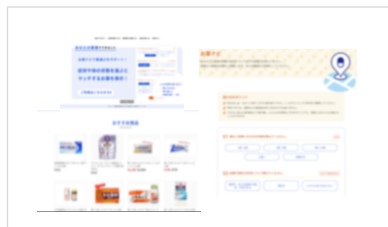
【オンライン購入サイトイメージ】

サイト上に、お薬選びをサポートする機能も実装し、自分自身に合うお薬選びの大切さの周知・啓発も行った。